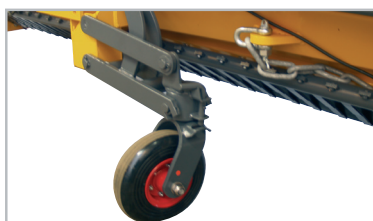
Justierbares Stützrad für Absetzung - leicht zu montieren und abmontieren.

Datenerfassung: Es ist möglich, die EpoLink Datenerfassungsbox für die Übertragung von Streudaten zu Vinterman Light zu installieren.