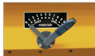
Dosierskala für Änderung der ausgelegte Menge.